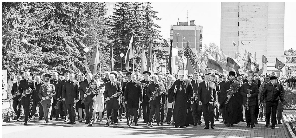
После возложения цветов глава митрополии совершил заупокойную ли-